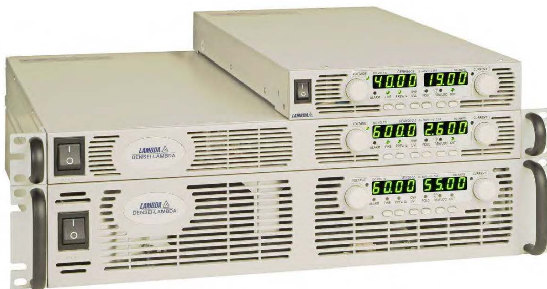
Рисунок 1 – Фотография общего вида

Защита ПО от непреднамеренных и преднамеренных изменений соответствует уровню «А» по МИ 3286-2010.